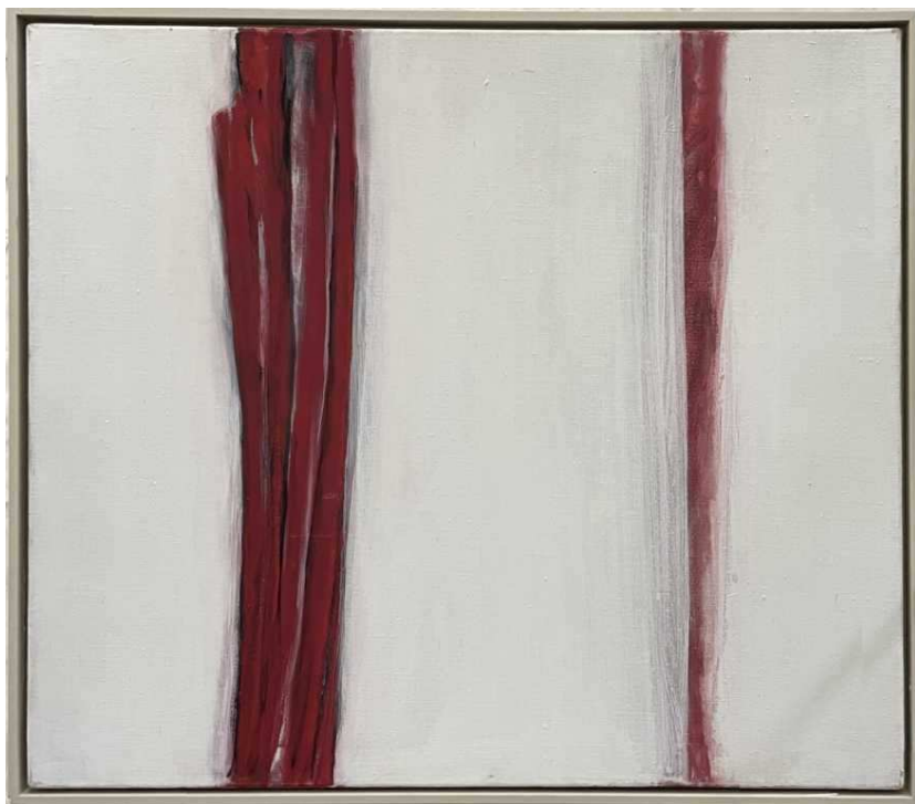
Ohne Titel, 2013, Oel auf Leinwand, 76 x 85cm

* Bachmann-Zyklus aus dem Buch „Briefe an Felician“, 1991