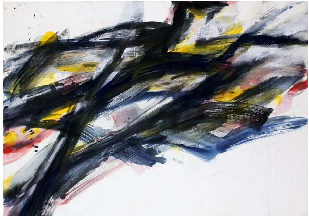
Horizontal, 2006, Öl auf Leinwand, 60 x 85 cm